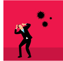
Estudios jurídicos. Guía para aprovechar