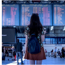
Viaje a los conflictos aerocomerciales