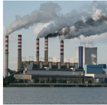
Delitos ambientales y residuos