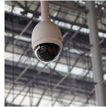
Normativas de emergencia y protección de