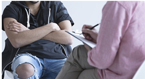
Figura 2. Psicología penitenciaria.

Lo anterior se enfoca a los casos de atención a víctimas de probables delitos, donde según el delito es el modo de atender o abordar a los sujetos, por otro lado, si se trata del médico o criminalista en múltiples ambientes donde se ha dado cierto hecho que se presume delictuoso, ha de aplicar ciertas habilidades que varían de contexto en contexto, por el lado de jueces, abogados, defensores, acusadores, la interpretación es factor importante, así, no siendo limitativa la lista anterior, sino descriptiva brevemente por las profesionales más ocupados en este ambiente, se mencionan, mismas que serán reiteradas en la explicación de las inteligencias para su ámbito profesional.