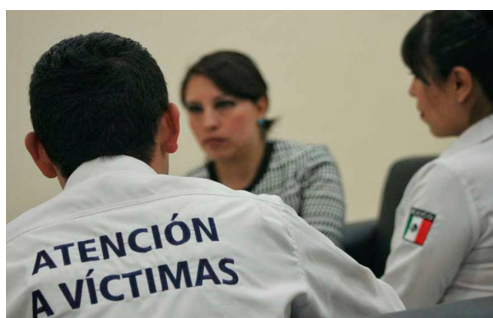
Figura 3. CEEAC fortalece esquemas de atención a la ciudadanía. Recuperado de https://www.elsoldesanluis.com.mx/local/ceeav-fortalece-esquemas-de-atencion-a-la-ciudadania-3952667.html

Inteligencia lingüística: Los profesionales de la psicología forense y criminólogos, se han de encontrar ante casos de violaciones sexuales, abusos, maltrato, ofensas (Novo, Herbón y Amado, 2016), lesiones, las anteriores pueden ser de una sola ocasión por algún sujeto conocido o desconocido, o de forma reiterada a largo plazo, víctimas que han sido dañadas en su físico, emociones, mente, que les torna reprimidos, temerosos, desconfiados, inseguros, o agresivos. Por ejemplo, existen niños que crecen en ambientes desfavorables para su sano desarrollo, lo que ocasiona efectos en su crecimiento personal (Mata, Gómez-Pérez y Calero, 2017).