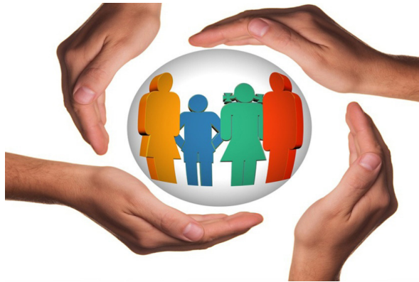
Figura 8. Protocolo para atender y proteger a las víctimas de violencia. Recuperado de https://observatorioviolencia.pe/protocolo-para-atender-y-protger-a-las-victimas-de-violencia

Inteligencia interpersonal: Tal cual se toma con la descripción de este tipo de inteligencia, el psicólogo, psiquiatra, victimólogo, criminólogo, deben interesarse por los intereses de los demás, conocer sus motivaciones, tanto para haber cometido un delito, así como su interpretación al padecerlo, recordar el caso, los detalles, buscar modos de apoyar a las personas, comprenderles.