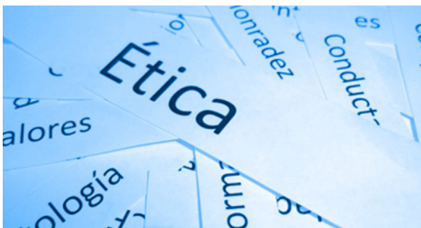
Figura 10. Lecciones sobre deontología del periodista en la era digital. Recuperado de https://www.clasesde-periodismo.com/2016/04/12/lecciones-sobre-deontologia-del-periodista-en-la-era-digital

En ese sentido expresado, el profesional de cualquiera de estas áreas debe comenzar por la empatía sobre los hechos que ha de atender, que podría concentrarse en la inteligencia intrapersonal e interpersonal.