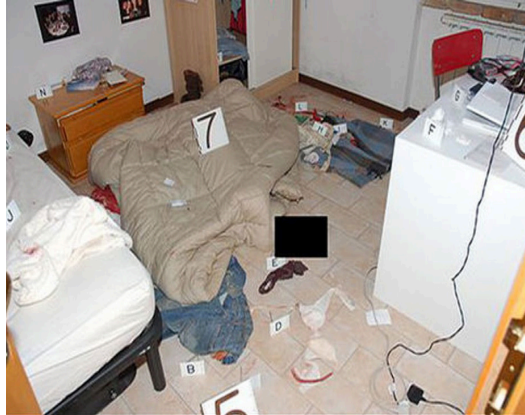
Figura 7. La escena del crimen tal y como la halló la policía.