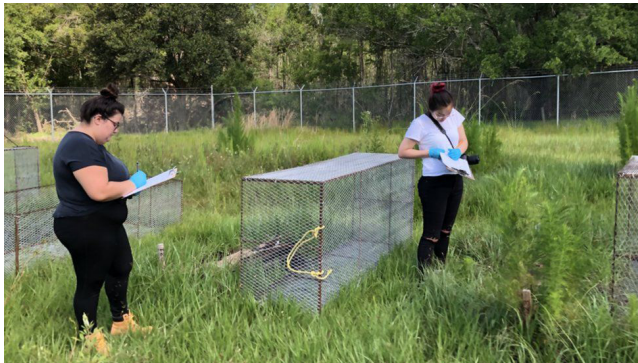
Figura 8. Qué son las “granjas de cadáveres” donde los cuerpos humanos se descomponen a la intemperie (y por qué causan controversia incluso entre científicos). Recuperado de https://www.bbc.com/mundo/noticias-48538093

Esta inteligencia, por un lado, nos puede ayudar a comprender la cultura, tradiciones, ambientes naturales que hay, y que determinan la conducta de los sujetos. Por otro lado, para los peritos en biología, química, antropología, medicina, u otros, el ambiente genera condiciones sobre los cuerpos, ya sea por calor, frío, humedad, resequedad, putrefacción (Hernández Espinoza, 2016; De Luca, 2011).