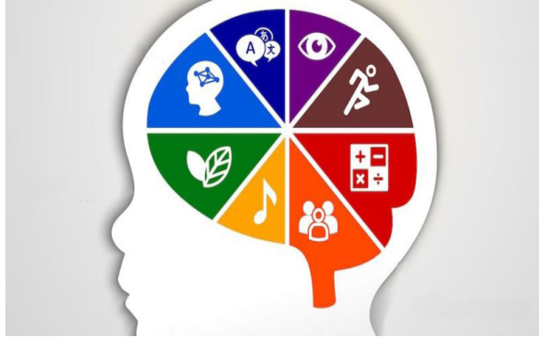
Figura 1. Teoría de las inteligencias múltiples.