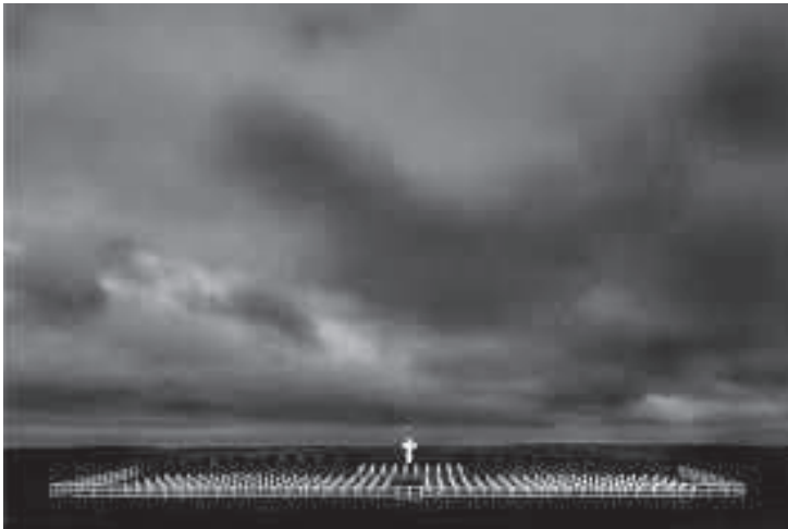
Imagen Cementerio Militar Argentino de Darwin.

Darwin es, un eco de la guerra, aunque alejado de las poblaciones, está presente. Azotado por el viento, que ruge entre las cruces como un grito. Nada mas puede oírse, el viento, y el golpeteo de los rosarios, cientos de ellos, colgados en sus cruces blancas.