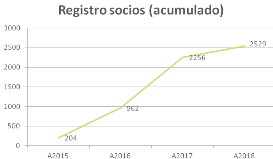
Gráfico 4. Solicitudes de registro por año (aprobadas y vigentes)