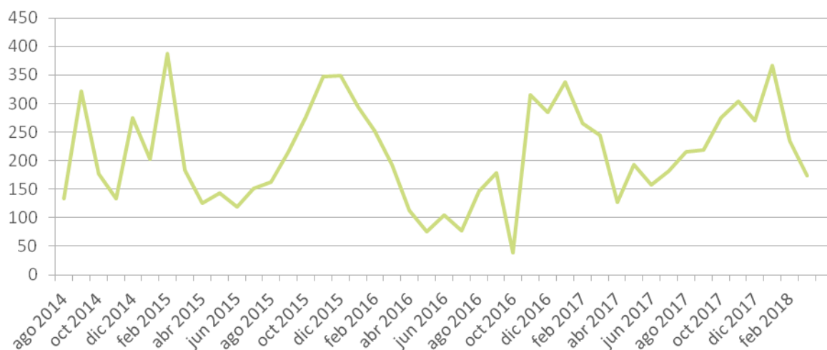
Gráfico 2. Registros por mes de autocultivadores