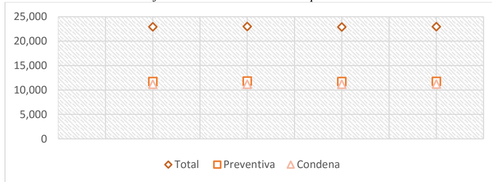
Gráfico No. 2 PPL Guatemala sep–dic 2017

Fuente: Elaboración propia con información de la Dirección General del Sistema Penitenciario.