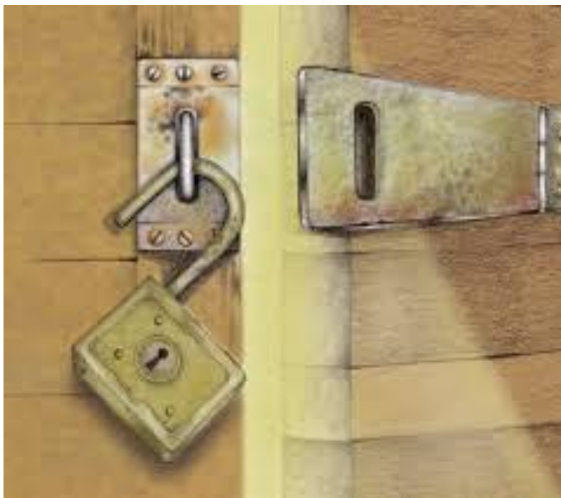
Imagen extraída de portada de publicación sobre la implementación del Protocolo Facultativo a la Convención de Naciones Unidas contra la Tortura, (APT/Suiza).

detención sean objeto de inspecciones periódicas e independientes, incluidas las actividades de vigilancia que llevan a cabo las organizaciones no gubernamentales. El Comité alienta al Estado parte a ratificar el Protocolo Facultativo de la Convención contra la Tortura y Otros Tratos o Penas Crueles, Inhumanos o Degradantes” (ver observaciones finales al informe de Colombia, punto 20, también disponibles en este enlace oficial de Naciones Unidas)