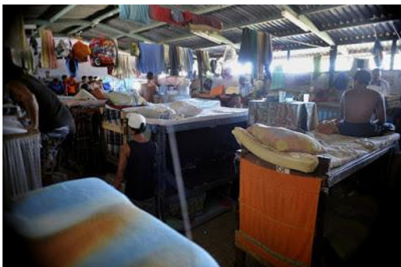
Foto extraída de artículo de prensa del 2015 titulado "Hacinamiento en cárceles alcanza cifra récord de 51%", La Nación (Costa Rica), 11 de marzo del 2015

“De acuerdo con el parámetro internacional, cualquier sistema de reclusión o prisión que trabaje bajo condiciones de hacinamiento superiores a 20 por ciento (es decir, 120 personas reclusas por 100 plazas disponibles) se encuentra en estado de “sobrepoblación crítica”. Una situación de “sobrepoblación crítica” puede generar violaciones o desconocimiento de los derechos fundamentales de los internos” (p. 3).