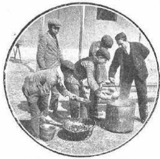
IMÁGENES 3 y 4

“La tumba en marcha” y “No arrempujen que hay pa’ todos” son los epígrafes que acompañaban las imágenes. “Acuérdense de nosotros”, Caras y Caretas , N°627, 8/10/1910