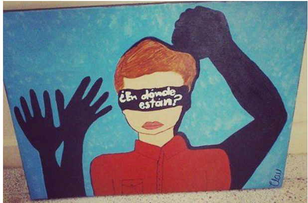
Arte patológico. Producción de alumna del Bach. Cruz Azul