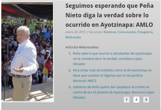
Mesianismo de López Obrador, oportuno para su nueva candidatura. www.lopezobrador.org.mx/