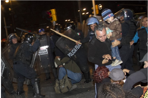
La banalidad del mal.

La investigación documental arrojó imágenes, textos hiperfrásticos a partir de los cuales se infirieron categorías interpretativas, anotadas al pie de cada evidencia junto con su fuente.