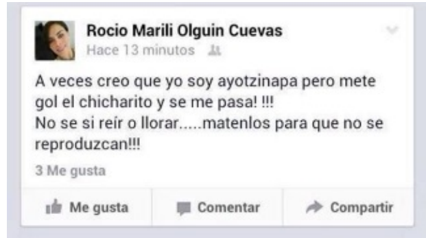
Exdiputada apologiza la masacre: “mátenlos para que no se reproduzcan”. www.facebook.com