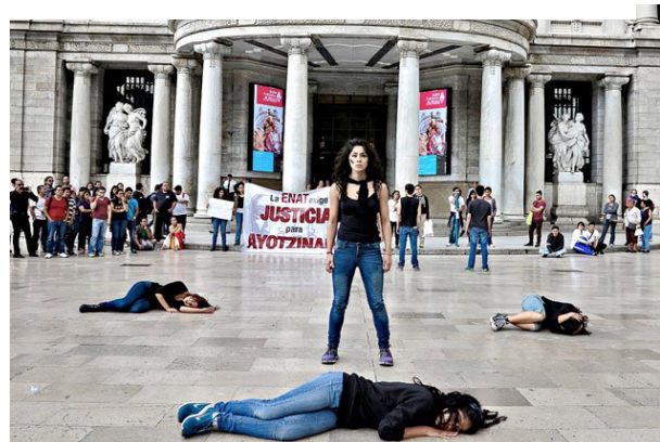
Arte patológico. www.culturacolectiva.com