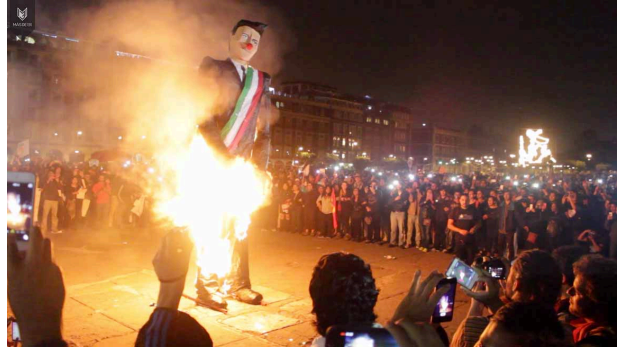
Crisis del Leviatán. www.masde131.com