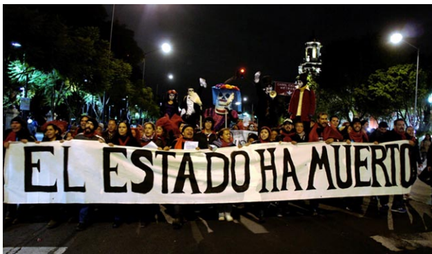
"El estado ha muerto". www.twitter.com