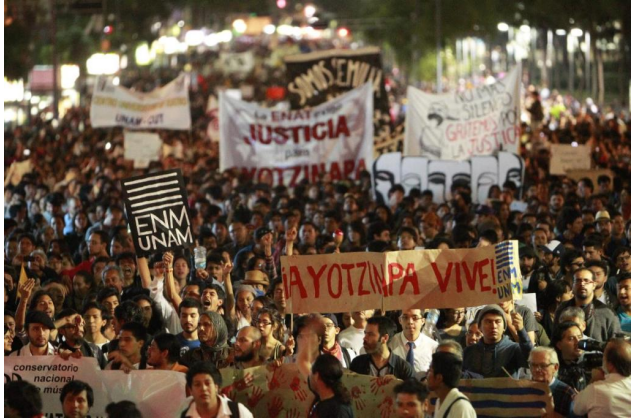
Manifestación del espíritu de protesta. www.twitter.com