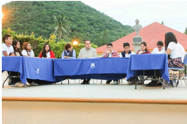
Pensar la catástrofe. Mesa de debate "La familia, roles y Estado" en Lagunas, Oax.