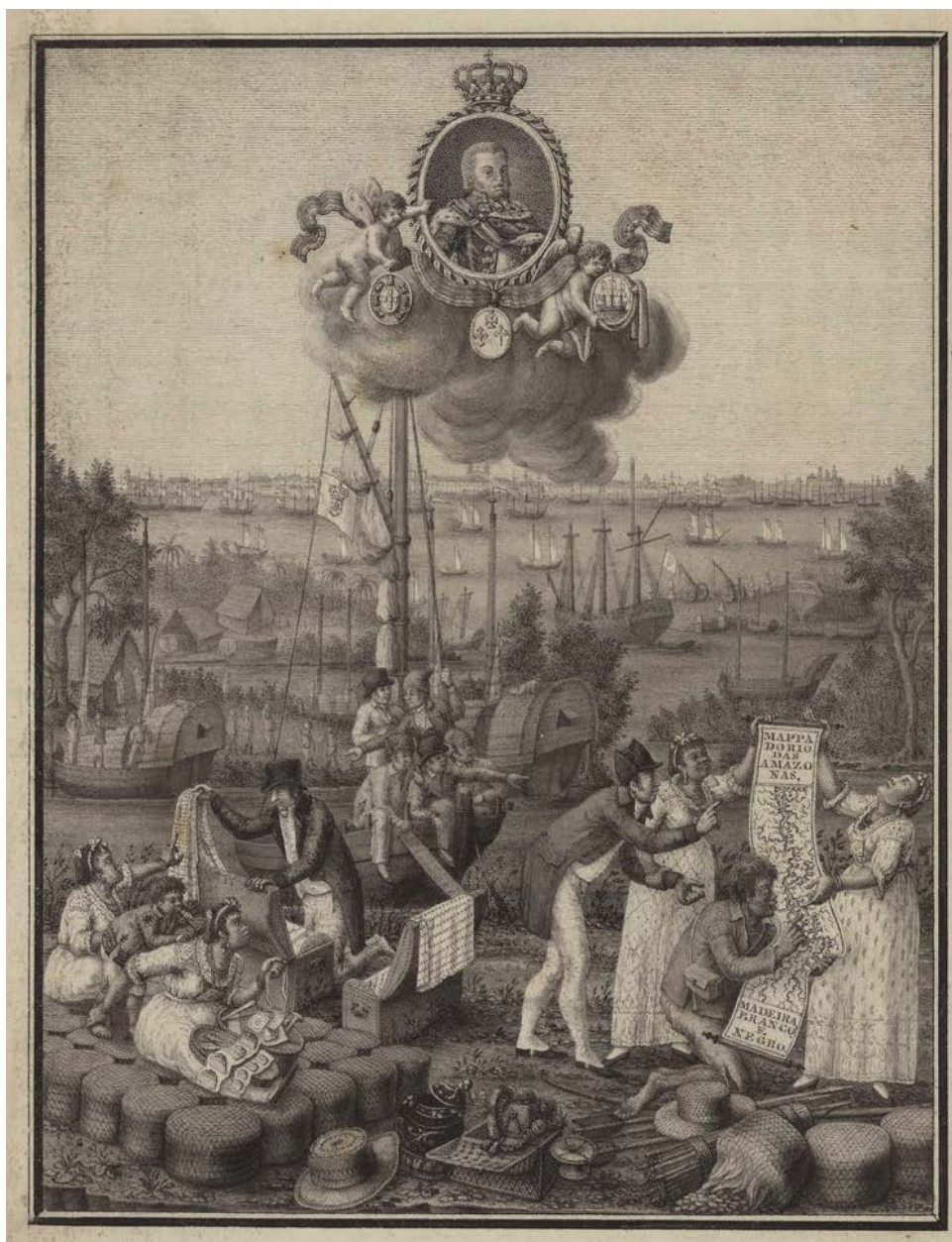
Figura 1: Frontispício Alegórico