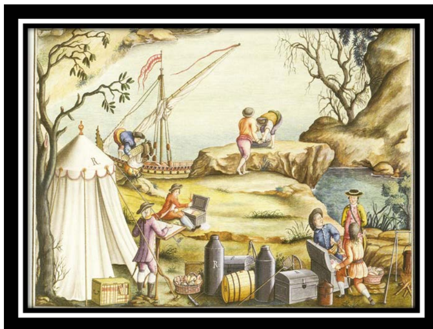
Figura 2: Tavares da Fonseca. Diseño en acuarela. "Riscos de alguns Mammaes, aves e vermes do Real Museo de Nossa Senhora da Ajuda". (Faria 2001: 29)