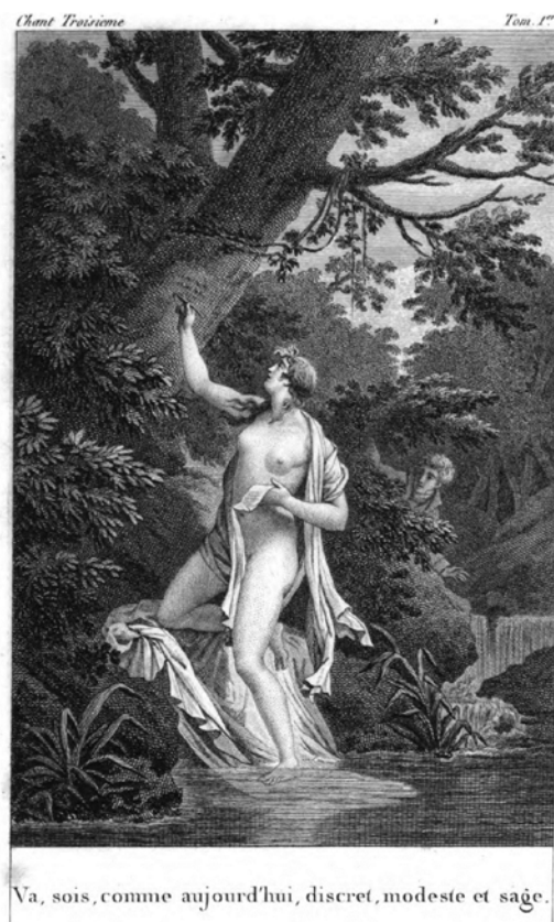
Figura 1: Ilustración del episodio de Musidora sorprendida en el baño de Les Trois Règnes de la Nature , Tomo I, París, 1808.