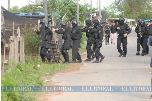
Figura 5. Fuente El Litoral, 10/10/2018.

El mismo medio en una nota utilizó una galería de veintinueve (29) fotos, concretamente para contar el OSP efectuado el día 10 de octubre de 2018 31 , denominado “operativo integral”. A través de las mismas se mostró, entre otros, el despliegue de personal policial a pie, mientras realizaban allanamientos en una vivienda precaria: