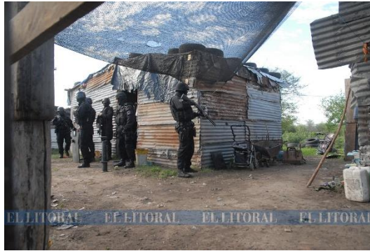
Figura 7.

Las fotografías recuperadas fueron tomadas por un reportero gráfico, según consta en las noticias. Se observa que se mostró a la policía armada como protagonista de la escena, mientras ingresaban a una vivienda precaria ubicada en un barrio vulnerable de la ciudad de Santa Fe.