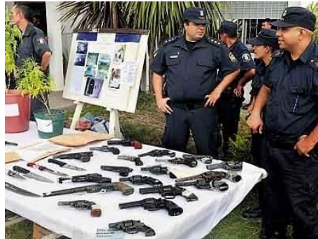
Figura 12.

Además, hay que agregar que el titular "Doscientos detenidos en megaoperativo" del 12/2/2011 de Diario Popular, estaba acompañado con la siguiente fotografía: