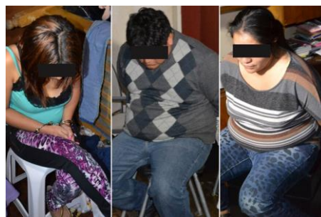
Figura 14.