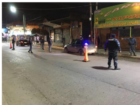
Figura 10.