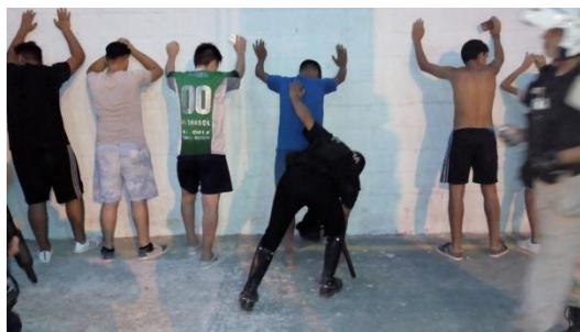
Figura 9. Fuente Diario Popular, 19/2/2018.