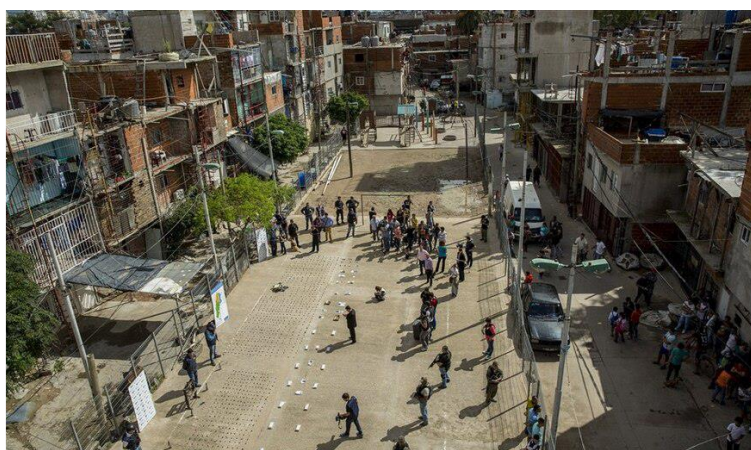
Figure 15.