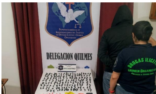
Figura 11.

La particularidad de este medio fue que no indicó las fuentes en ninguna de las imágenes que presentó. Como vemos, todas las imágenes coinciden en resaltar la actuación policial: en las figuras 8 y 9 revisan a personas detenidas; en la figura 10 se