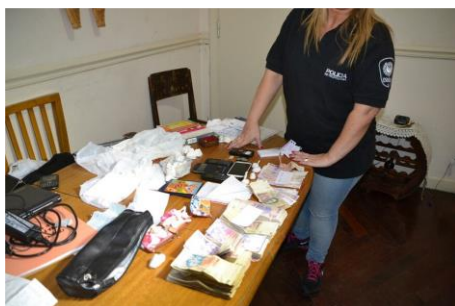
Figura 13.

En las fotografías de este medio digital se advirtió que mayormente mostraban los elementos secuestrados en los operativos, como droga, armas, dinero o celulares, o las personas detenidas: