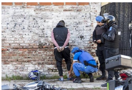
Figura 8.

Por otro lado, Diario Popular en la mayoría de sus noticias ilustró con fotografías, pero no fue usado ningún otro recurso audiovisual. En ellas, por lo general, se ve personal policial apostado en la vía pública, personas detenidas o elementos secuestrados, como se observa en las siguientes imágenes: