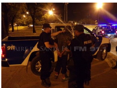
Figure 3. Fuente Aire Digital, 18/9/2016.

No se observó cita de la fuente de las dos fotografías recuperadas, rasgo que caracterizó prácticamente a todas las notas con imágenes de este medio. En un caso –que se recupera a continuación- se citó al Ministerio de Seguridad como “fuente”, y en otro se destacó que eran “imágenes suministradas por el Gobierno de la Provincia” (Aire Digital, 10/10/2018) 30 :