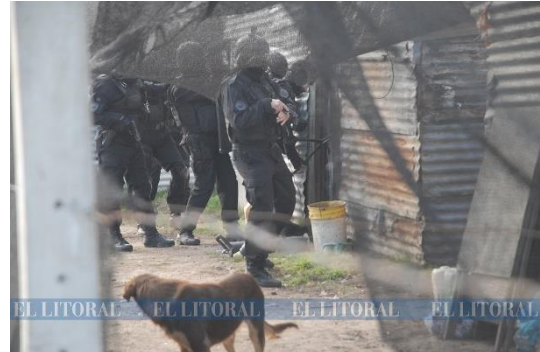
Figura 6. Fuente El Litoral, 10/10/2018.