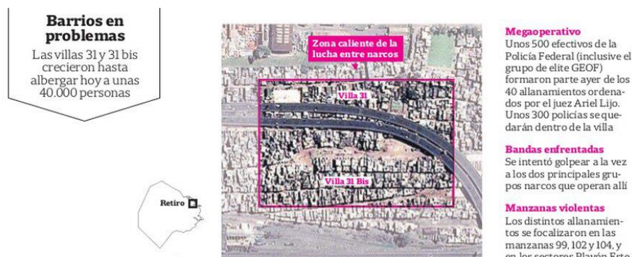
Gráfico 1. Fuente La Nación, 8/4/2016.

La Nación utilizó fotos en la mayoría de sus noticias, y videos en algunas de ellas. En un solo caso, se utilizó una infografía, aunque sin interactividad, a diferencia de lo observado en otras investigaciones sobre medios digitales (Zunino & Grilli Fox, 2020):