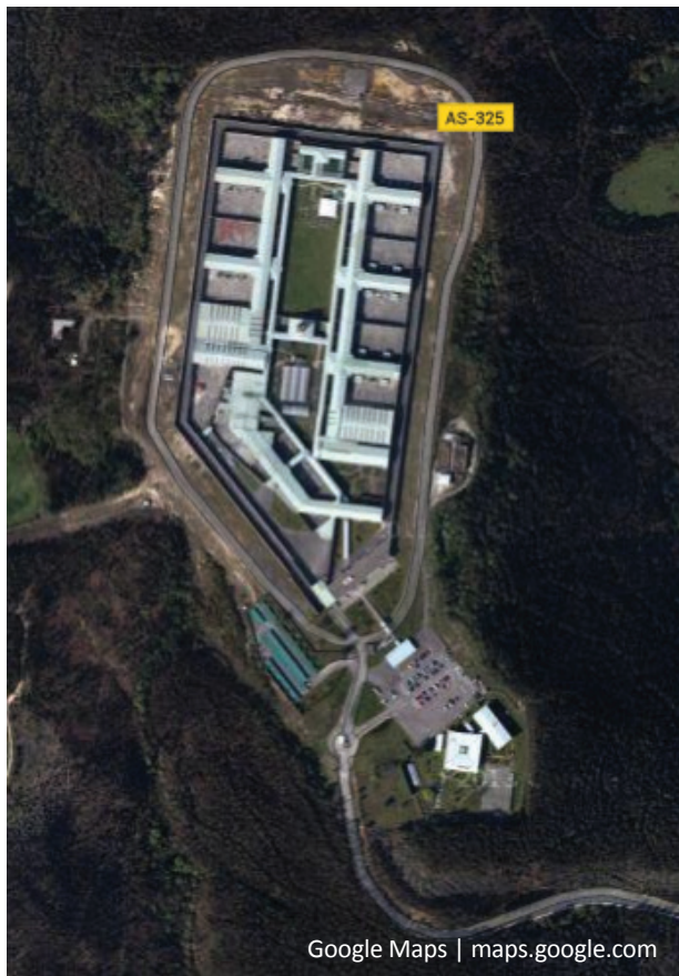
Vista Aérea del Centro Penitenciario de Villabona

tradicional. Se busca superar las funciones de custodia en pro de la intervención terapéutica y educativa destinada a la reinserción social del penado.