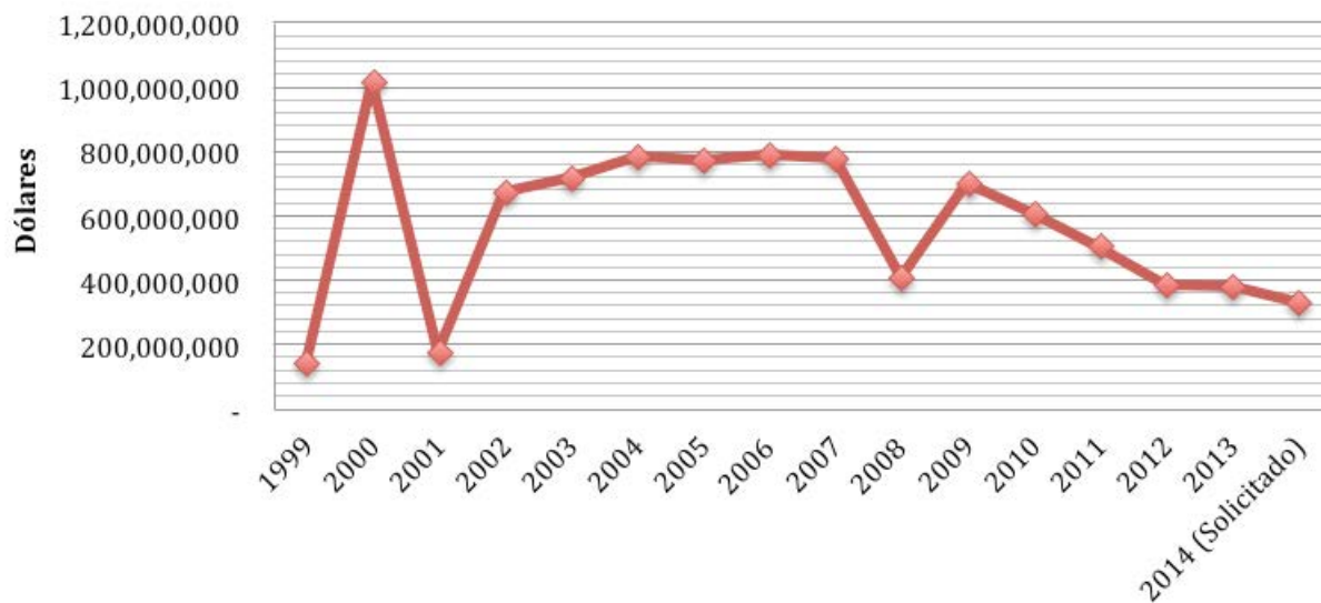
Gasto de la Estrategia Internacional de control de narcóticos de EEUU en el Hemisferio occidental

Adicional a los programas financiados por Estados Unidos, cada país invierte recursos en política antidrogas y ha modificado su legislación con el fin de restringir el tráfico y consumo de drogas ilícitas.