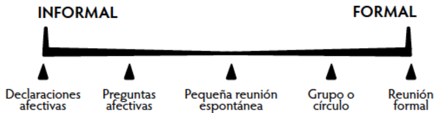
Figura 4. Espectro de Prácticas Restaurativas

En el siguiente diagrama se indica que las prácticas restaurativas tienen un rango que va de lo informal a lo formal. Dentro de ese amplio espectro, en el ámbito informal se encuentran las declaraciones afectivas que comunican los sentimientos de las personas, así como las preguntas afectivas que permite reflexionar respecto del impacto de la conducta sobre otros. Las reuniones restaurativas espontáneas, así como los grupos o círculos, son más estructurados. La reunión formal, en cambio, requiere una preparación elaborada. Mientras más formal sea la práctica, se exige una mayor planificación, estructuración y participación de las partes, teniendo por lo tanto un carácter más complejo y resultados con un mayor impacto restaurativo.