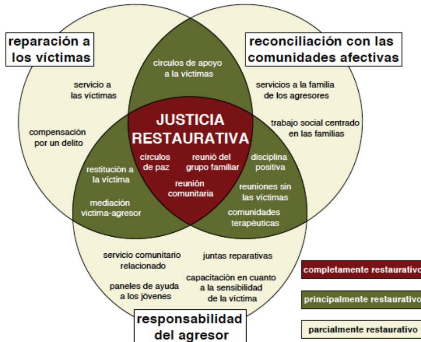
Figura 2: Tipología de la Justicia Restaurativa