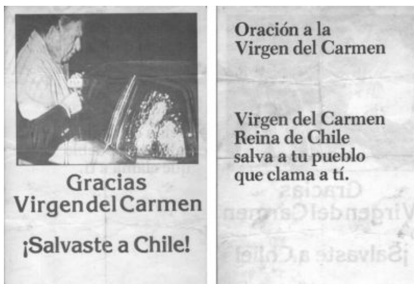
Fig. 4. Oración a la virgen del Carmen con ocasión del atentado a Pinochet 67

Pinochet, herido pero fuerte, aparece junto a periodistas de 60 minutos y radio Cooperativa dando cuenta, horas más tarde, de los daños sufridos por su comitiva. Los muertos y heridos se convirtieron en héroes para los seguidores del dictador, y además, se manifestó la Virgen María en una ventana acribillada. A las pocas horas, comienza la reacción de los órganos del régimen. Se producen una serie de detenciones a lo largo del país; entre los detenidos, Lagos Escobar; entre los muertos, José Carrasco tapia. Entre los sospechosos, José Toribio Merino 66 .